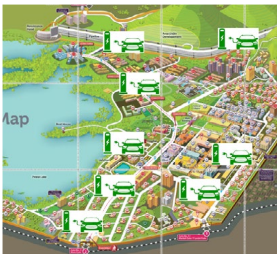
Przypadek 3: Budynek zasilany energią solarną na KAMPUSIE IITB w Bombaju lokalizacją ładowarek dla pojazdów elektrycznych (po prawej).