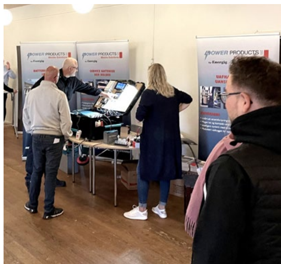
Targi Energetyczne w Stjær, wrzesień 2021 r.