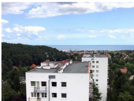
Widok z dachu jednego z bloków Spółdzielni Mieszkaniowej im. A. Mickiewicza w Sopocie

Jakie działania są obecnie planowane dla tej społeczności lokalnej w ramach programu SUSTENANCE? Dedykowany, zintegrowany system energetyczny, który łączy produkcję i magazynowanie energii elektrycznej z odnawialnych