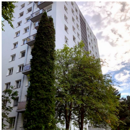
Widok jednego z bloków Spółdzielni Mieszkaniowej im. Mickiewicza w Sopocie

Wszyscy polscy członkowie zespołu SUSTENANCE są ważnymi uczestnikami lokalnego rynku energetycznego i będą aktywnie partycypować w działaniach pokazowych oraz wspierać Zarząd WSM w tym projekcie. IMP PAN pełni funkcję koordynatora prac, ENERGA-OPERATOR S.A. to lokalny dostawca energii elektrycznej, który zmodernizuje lokalną stację transformatorową i zamontuje inteligentne mierniki, STAY-ON Energy Management zainstaluje magazyn energii (w bezpiecznej technologii przepływowej) oraz zaprojektuje, zintegruje i uruchomi autorski system zarządzania energią nadzorujący pracę wszystkich istotnych elementów