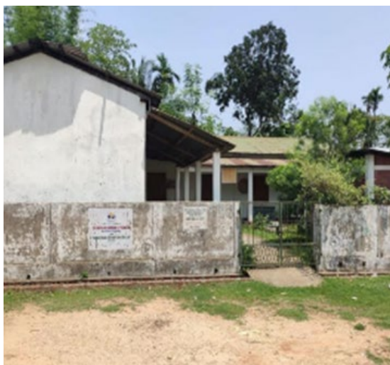
Przypadek 2: WIOSKA BORAKHAI, dąży do utworzenia inteligentnych klastrów na bazie lokalnego systemu energetycznego zasilanego z odnawialnych źródeł energii.