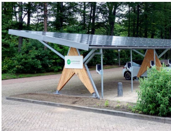
Lokalizacja testowa solarnej wiaty samochodowej na Uniwersytecie w Twente

przekazania wiedzy innym grupom. W szczególności skoncentrujemy się na potencjalnych lokalizacjach testowych w Olst i mieszkańcach lokalnej wspólnoty energetycznej o nazwie „Vriendenerf” („Ogród Przyjaciół”), gdzie solarne instalacje PV i pojazdy elektryczne są już dostępne. Ponadto, mieszkańcy tych lokalizacji mają dobrze izolowane domy z pompami ciepła. Ponieważ ci obywatele są osobami starszymi, grupa będzie znacząco różnić się od zaawansowanych technicznie użytkowników na Uniwersytecie w Twente, co stworzy dodatkowe wyzwania, w tym uczynienie systemów jeszcze bardziej intuicyjnymi i wygodnymi, a mniej intryzywnymi dla użytkowników końcowych. Niemniej jednak, tych obywateli także cechuje wysoka świadomość konieczności zmiany postępowania w celu utrzymania planety zdolną do zamieszkania dla przyszłych pokoleń, a więc gotowość do współpracy z nami!