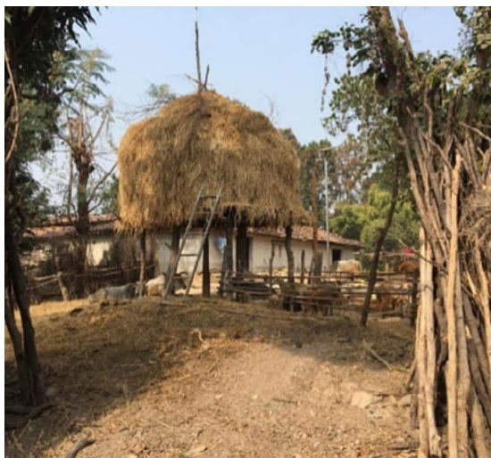
Przypadek 1: WIOSKA BARUBEDA, dąży do tego, aby stać się wspólnotą energetyczną neutralną pod względem emisji CO 2 w modelu wyspowym.